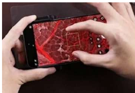
スマートフォン本体のデジタルズーム併用で200倍以上の大きさに拡大も可能

※レンズの位置によっては対応機種内であっても取り付けられない場合があります。 (対応機種例：iPhone12～15、Pixel7、8、Galaxy S23、S24その他のiPhone、Android)