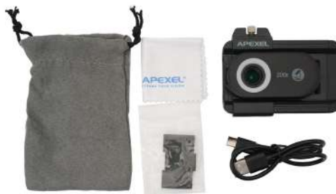
付属品：スペーサー (3サイズ)、防水ケース(布) USB Type-C、クリーナー